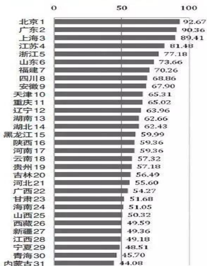
图3 2015年知识产权创造发展指数